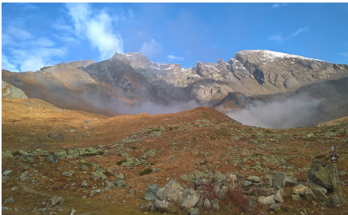
Paesaggi nascosti della “COUNBA FREIDA”

Note Tecniche. La prova si è svolta sull'ormai tradizionale territorio della “Counba Freida” dove ormai da alcuni anni, la prova viene ospitata nei Comuni di Valpelline- Oyace- e Bionaz . Le tracce più alte sono sempre disposte a ridosso della grande diga di “Place MOULIN” con base logistica in località Lexert presso il Camping LEXERT Gestito dalla Famiglia Favre, che come ogni anno si prodica e offre una ospitalità cordiale e sempre disponibile ad ogni nostra esigenza. Tracce tecnicamente impegnative in geografia tipicamente alpina ormai collaudata che non consente molte variazioni al tema e i percorsi trovano giusta collocazione in un ambiente montano di grande spettacolarità. Lunghezze omogenee, in un habitat boschivo che si alterna in zone rocciose ,latifoglie , con abeti e larici secolari che fanno da corollario nella parte alta con ampie radure alpine (popolate da intriganti Marmotte che rendono vita non facile ai cani), tutte rispettose del regolamento vigente. La massiccia presenza della Selvaggina avvistata su tutte le tracce – Camosci -stambecchi – caprioli e cervi, oltre alle citate marmotte non è più un segreto ,è la nostra ricchezza inestimabile che consente di dare valore aggiunto a questo tipo di rassegna e nello stesso tempo rende preziosi questi luoghi.